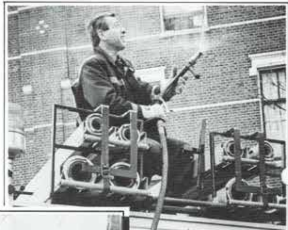
AC Rotterdam, nader bericht, we redden met 1 HD...