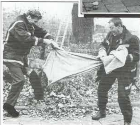
AC Rotterdam hier TAS 110, over. Zegt u het maar, over.