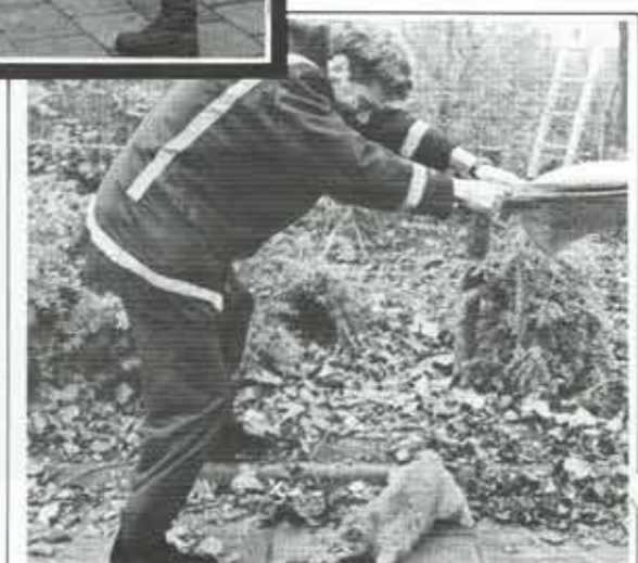
Kat veilig geland en we rukken in, over. Kat geland en u rukt in begrepen hoor en uit.