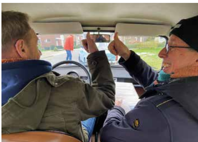
'Alles onder controle'