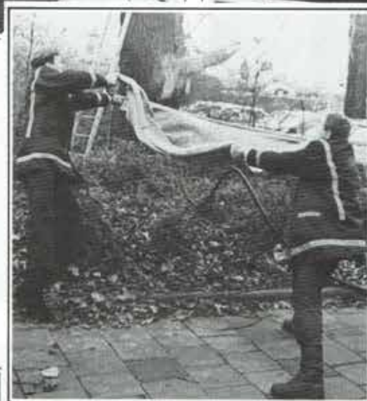
... en een deken, over.