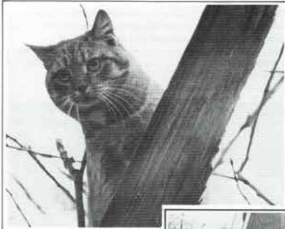
AC Rotterdam TAS 110 ter plaatse, over.