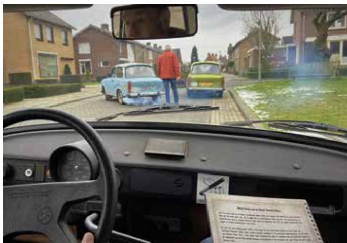
'Met de vlam in pijp...'